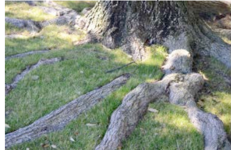
Protection du sol par les racines.