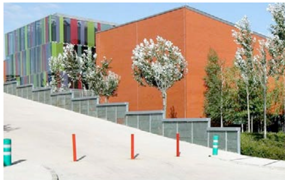
Photo: Hospital Río Hortega Valladolid. Source : https://www.consalud.es/c-medico-de-referencia/hospital-universitario-rio-hortega_23654_102.html

Il s'agit d'arbres à proximité de cours de récréation, de campus, d'hôpitaux, de quartiers commerciaux et d'affaires, de centres-villes, de zones industrielles et de zones résidentielles pour offrir des espaces de divertissement et pour améliorer la qualité de vie. Ces forêts urbaines sont délibérément installées à proximité de bâtiments spécifiques afin d'améliorer la qualité de vie de groupes particuliers de personnes (enfants, élèves, personnel et patients des hôpitaux) et de favoriser les activités commerciales et touristiques dans les villes.