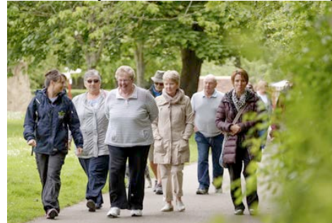
Activité de marche au Royaume-Uni - Source : The Mersey Forest.