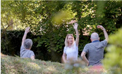
Amélioration de la santé physique.

Comprend les arbres dans les parcs publics, les parcs forestiers, les villes historiques et les points de vue à des fins esthétiques et de détente. Ces forêts urbaines ont pour principal objectif de générer une atmosphère de bien-être dans les villes où les citoyens peuvent profiter d'espaces naturels (observation du paysage, marche, sports, etc.) durant leur temps libre, améliorant ainsi leur santé physique et mentale. Ce type de forêt est directement lié à la biodiversité urbaine :