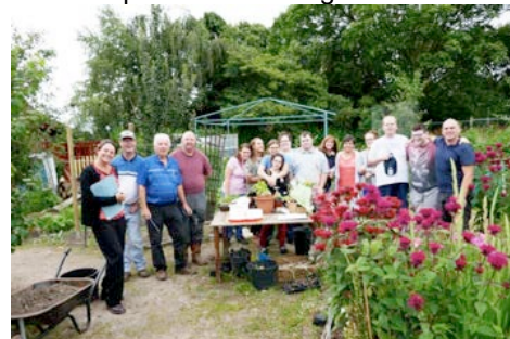
Activités communautaires de gestion des forêts urbaines.