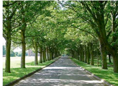
Forêt urbaine linéaire